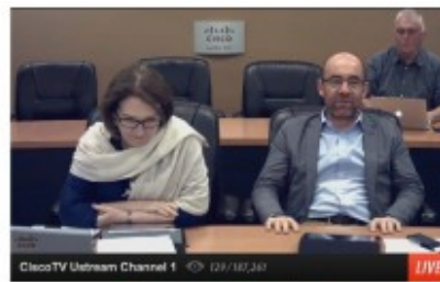
Umræður um nýjustu TALIS niðurstöður

Í tilefni af þessum mikilvæga viðburði var vefsíðu MenntaMiðju breytt til að auðvelda fólki að fylgjast með og taka þátt í umræðum. Bein útsending EFF með frummælendum málstofunnar var streymt í gegnum heimasíðu MenntaMiðju og umræðuþræðir tengdir málstofunni á Twitter hafðir þar fyrir neðan. Þátttakendur gátu því fylgst með frummælendum í mynd og um leið tekið þátt í samræðum við fólk um allan heim um þau atriði sem vöktu helst athygli. Einnig gátu þátttakendur beint spurningum til frummælenda í gegnum Twitter og lögðu þeir sig fram við að svara spurningunum bæði með Twitter "tístum" og í samtölunum sín á milli sem hægt var að fylgjast með í beinu útsendingunni.