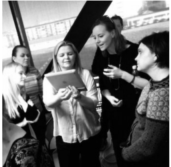
Áhugasamir þátttakendur í Útspili.

Á þriðjudag, 5. maí, mættu um 30 kennarar á tíunda og síðasta Útspilið sem haldið verður að sinni í tengslum við Samspil 2015 – átak Menntamiðju um notkun upplýsingatækni í námi og kennslu. Þar með hafa rúmlega 300 kennarar um allt land tekið þátt í Útspils námskeiði síðan átakið hófst í febrúar á þessu ári. En Útspilið er aðeins upphafið á árs löngu fræðsluátaki. Fræðslan færir nú að mestu yfir á netið þar sem þátttakendur munu nota samfélagsmiðla til að byggja sameiginlega upp öflugt og kvikt þekkingarsamfélag sem mun nýtast öllum kennurum landsins.